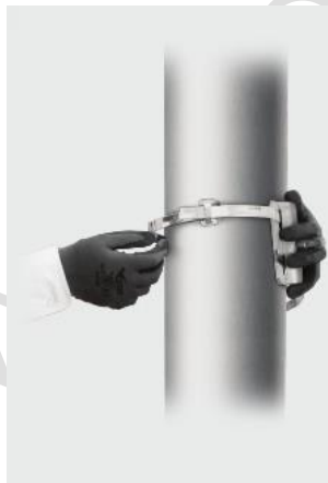
Foto 1. Cinta de Acero 3/4 Instalada.